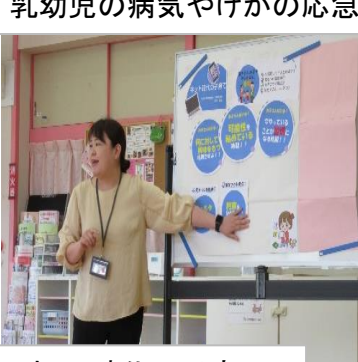
ネット時代の子育て