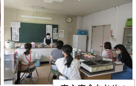
安心安全なおやつ