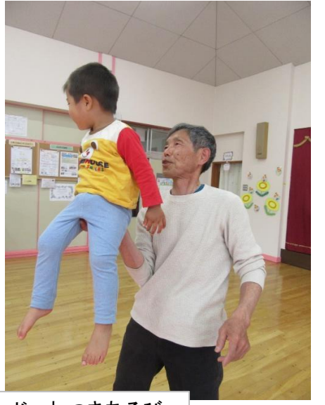
じゃれつきあそび