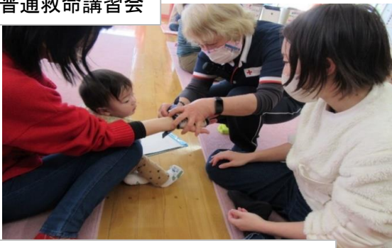
乳幼児の病気やけがの応急手当て